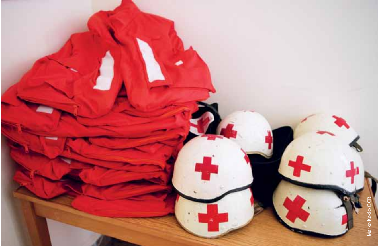
Cascos y chaquetas que utilizan los socorristas de la Cruz Roja Libanesa.

a los voluntarios locales en la sala de control durante misiones delicadas, ya que su conocimiento de la zona local les permite identificar lugares y rutas más seguros para las ambulancias. Las competencias y la experiencia de los directivos son importantes en estas situaciones, como lo es también el fuerte enfoque jerárquico; al responder a incidentes críticos, se espera que las órdenes se cumplan de manera exacta y completa.