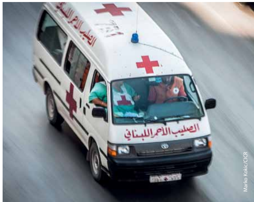
Ambulancia de la Cruz Roja Libanesa.

El amplio conocimiento del emblema de la cruz roja en Líbano y la escasa oposición al uso de la cruz roja en lugar de la media luna roja en una sociedad que, en opinión de algunos, está conformada en un 60 por ciento por musulmanes, son testimonio de la sólida reputación del Movimiento Internacional de la Cruz Roja y de la Media Luna Roja, y de la CRL en particular.