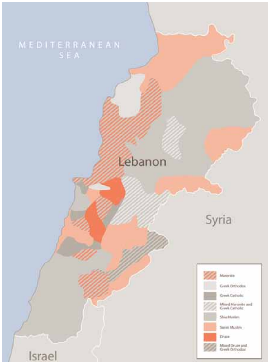
MAPA 2: DISTRIBUCIÓN DE LOS GRUPOS RELIGIOSOS EN LÍBANO

el gobierno libanés. En el acuerdo también se asignó categoría de prioridad nacional al desmantelamiento de la arquitectura confesional del Estado libanés; sin embargo, en términos generales, ese sistema sigue vigente al día de hoy. A excepción de Hezbolá, grupo transformado en una fuerza de resistencia nacional, las milicias fueron disueltas. Finalmente, la guerra terminó en 1990 y Siria retiró sus fuerzas en 2005.