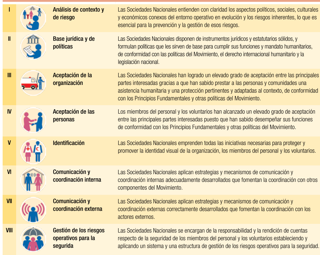
FIGURA 1: LOS OCHO ELEMENTOS DEL MARCO PARA UN ACCESO MÁS SEGURO

Habida cuenta de la vinculación entre los dos proyectos y la amplia experiencia de la CRL en materia de aplicación de los Principios Fundamentales para fortalecer la aceptación, la Cruz Roja Británica y el CICR colaboraron en la tarea de identificar las lecciones que se desprenden de la modalidad de trabajo de la CRL. Los objetivos del presente estudio de caso son, por consiguiente: