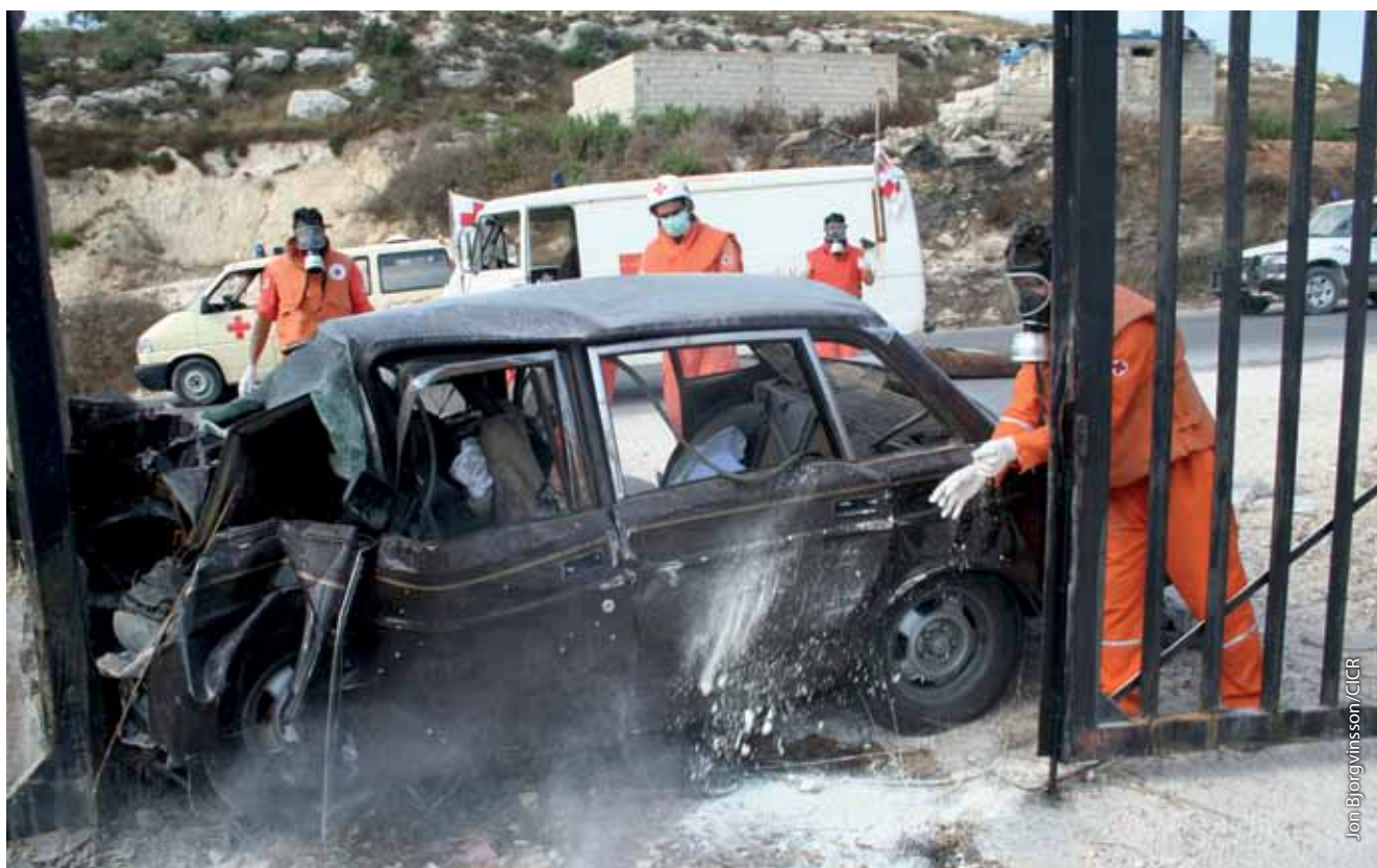
La CRL recoge los cuerpos de las personas que murieron a causa de una bomba cerca de Jouaiya, una aldea vecina a Tiro.

El papel de la CRL como operador del servicio nacional de ambulancias implica que a menudo se requiere coordinar las acciones con las autoridades, por ejemplo para asegurar la planificación concertada de los eventos públicos. Los representantes de las FAL, de Protección Civil y del ministerio de Salud señalaron la importancia de contar con un actor humanitario independiente y neutral que pueda prestar servicios a las personas que residen en todas las zonas y comunidades. Habida cuenta de este elevado nivel de coordinación y de la necesidad de contar con la confianza de los interlocutores, es importante que la CRL conserve su autonomía en lo que respecta a la toma de decisiones operacionales y que mantenga una distancia organizativa de todos los interesados, tanto en la realidad como a nivel de la percepción. Entre los ejemplos de la aplicación práctica de este enfoque figuran los siguientes: la CRL respondió negativamente a un pedido del gobierno de abrir un puesto en cierta localidad; para proteger su imagen de neutralidad, la CRL se negó a ponerse a disposición del organismo de Protección Civil durante las manifestaciones y prefirió estar de guardia para responder a situaciones de emergencia especiales a través de la línea directa nacional; la CRL transfirió a pacientes a centros de tratamiento donde consideraba que se sentirían seguros, en lugar de seguir el consejo de las autoridades de trasladarlos a otro lugar.