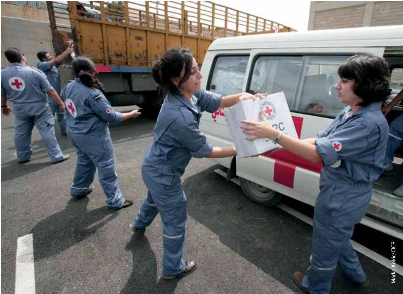
El valor del trabajo en equipo: los voluntarios cargan los paquetes de artículos de higiene y las mantas proporcionadas por el CICR en un vehículo de la Cruz Roja Libanesa para su distribución.

Los niveles directivos de la Sociedad Nacional han establecido sólidas relaciones con muchos interlocutores importantes, lo que destaca la importancia de invertir en las relaciones y en la construcción de la confianza a lo largo del tiempo.