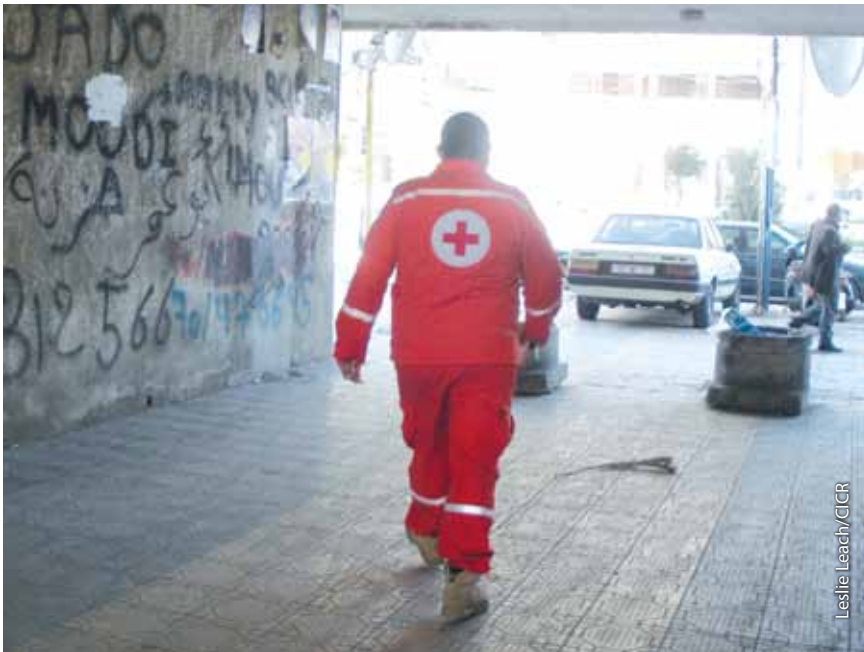
Un voluntario de los SMU se dispone a partir en misión, en Trípoli.