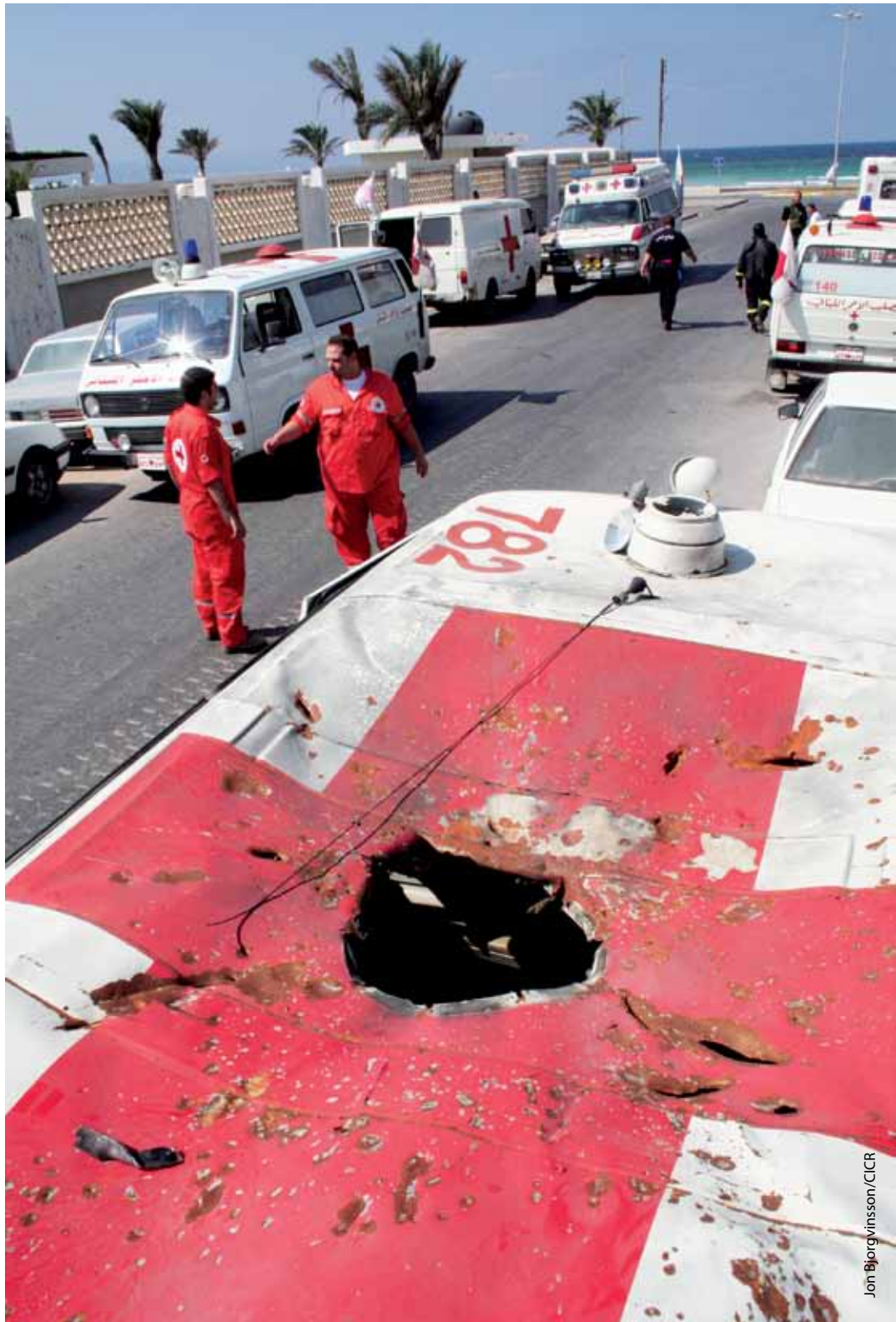
Ambulancia de los SMU dañada cerca de Qana, en 2006.

Esta realidad se puso de manifiesto en un incidente que tuvo lugar cerca de Qana, en el sur de Líbano, durante el conflicto armado de 2006 con Israel. Dos ambulancias de la Cruz Roja claramente marcadas, con buenas luces y con permiso de circulación, banderines de la Cruz Roja a los costados y luces estroboscópicas azules en los techos, transportaban a personas civiles. Pese a todas estas marcas, un misil impactó en la primera ambulancia y, unos minutos después, un segundo ataque hizo blanco en la otra. Nueve voluntarios de la Cruz Roja y los pacientes recibieron heridas.