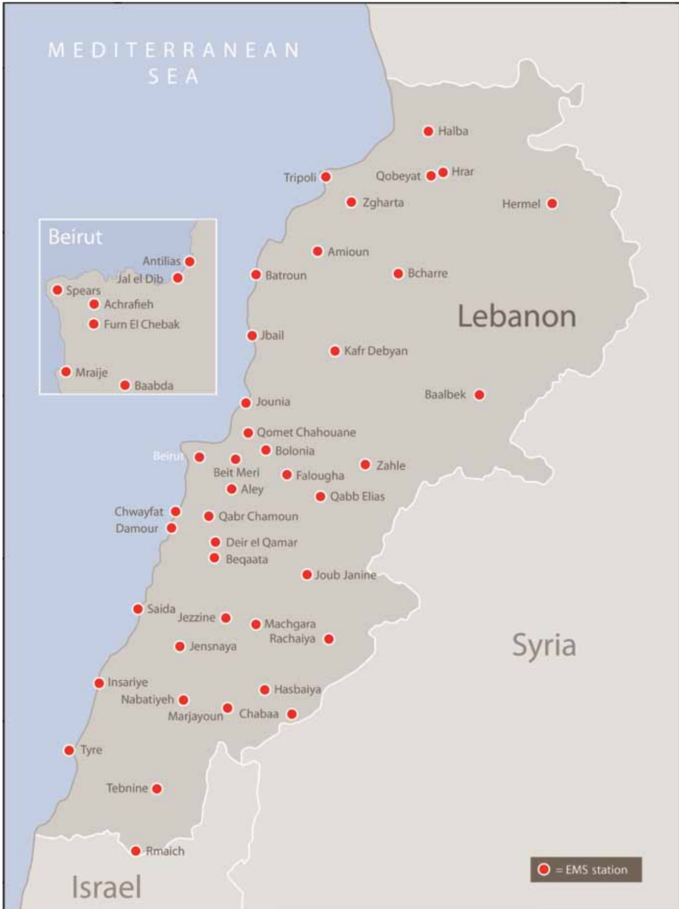
MAPA 1: LÍBANO Y LOS PUESTOS DE SERVICIOS MÉDICOS DE URGENCIA DE LA CRL